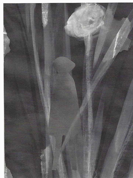
↑ Œuvres au noir, Encre et collage sur papier Japon, 27 x 20 cm

Nous retrouvons le vocabulaire de l'artiste, les végétaux, herbes, graminées s'élançant. La verticalité est sauve, mais les ténèbres se sont immiscées, l'œuvre est transformée par l'angoisse. Comme une pause dans le mouvement, des fleurs blanches, noires, rouges se détachent. Sur l'encre noire, un rouge éclatant cisèle un motif. De petites silhouettes grises ou violettes, comme des apparitions, errent dans la nuit. L'une d'entre elles est saturée de mots, mais le message est illisible. L'incommunicabilité est patente, la solitude poignante, les personnages sont perdus dans l'obscurité. ■