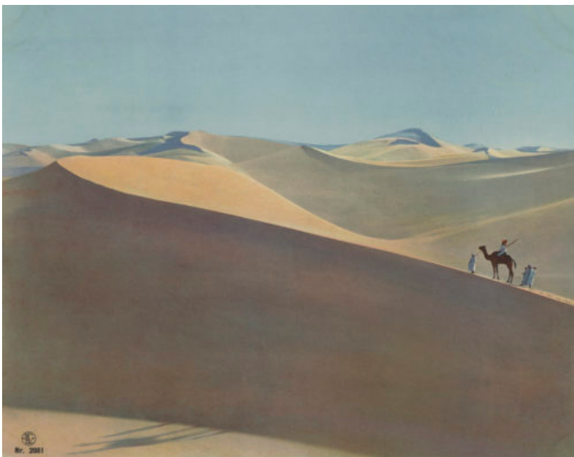
Photo Elysée propose une relecture critique des archives photographiques du studio Lehnert & Landrock, conservées dans la collection du musée depuis 1985. Actifs en Afrique du Nord au début du 20 e siècle, Rudolf Franz Lehnert (1878–1948) et Ernst Heinrich Landrock (1878–1966) ont construit et diffusé une iconographie de l'Orient à destination d'un public européen, profondément marquée par le contexte colonial de leur époque.

Après quoi nous vous proposons la collection Lehnert & Landrock , au Musée Elysée (au même endroit - Plateforme 10).